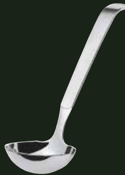
Saucenlöffel, 35 ml