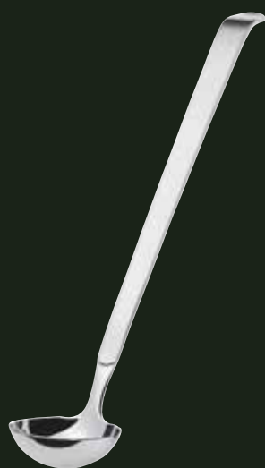
Dressinglöffel, 35 ml