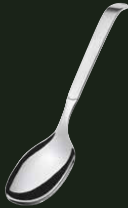
Servierlöffel, 25 ml