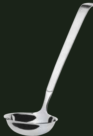
Vorleger, 100 ml