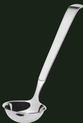
Portionsvorleger, 50 ml