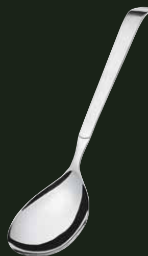
Chafing-Löffel, geschlossen, 50 ml