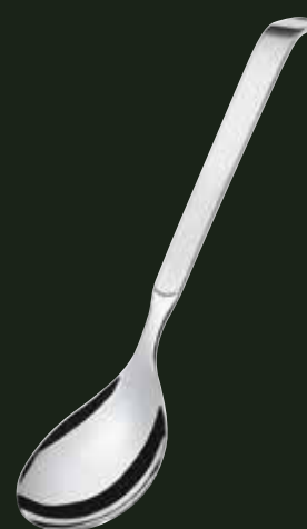
Salatlöffel, groß, 25 ml