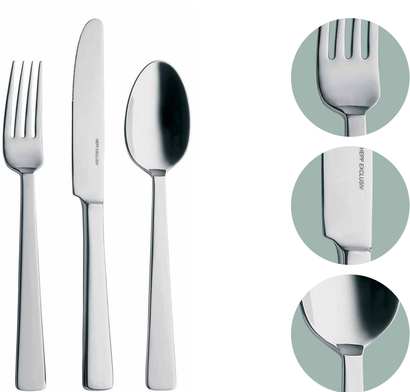
Abbildung 1:1 - Illustration 1:1

Striking, solid and full of character: the regal appearance of this collection expresses itself through powerful shapes and no-nonsense lines.